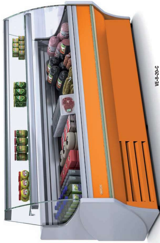
VE-8-20-C FRONTAL LACADO · LACQUERED FRONTAL · FRONTALE LAQUÉE