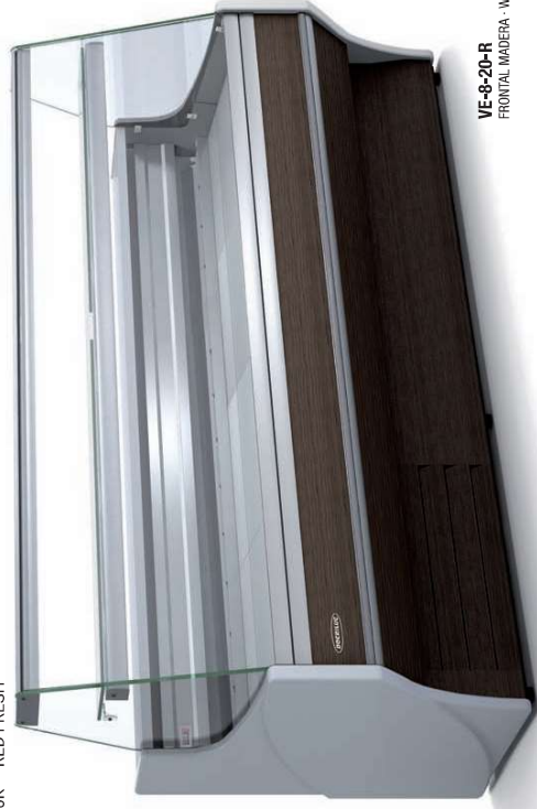
VE-8-20-R FRONTAL MADERA · WOOD FRONTAL · FRONTALE BOIS