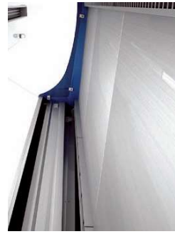
detalle plano de exposición display area detail Up detail de l'exposition