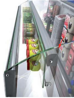
Estante superior no refrigerado Top shelf not refrigerated Étagère supérieure non réfrigérée