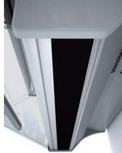
detalle periferia anodizada anodized profiles detail profilis anodisats détail