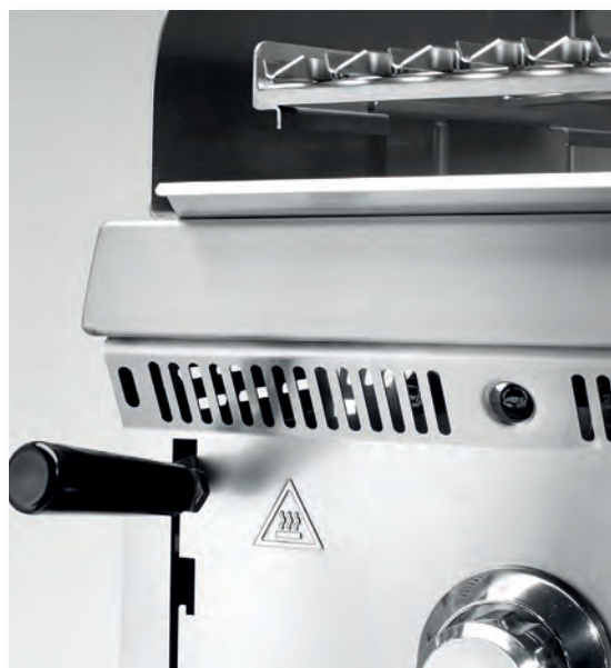
Elevador de rejillas Rack lifter